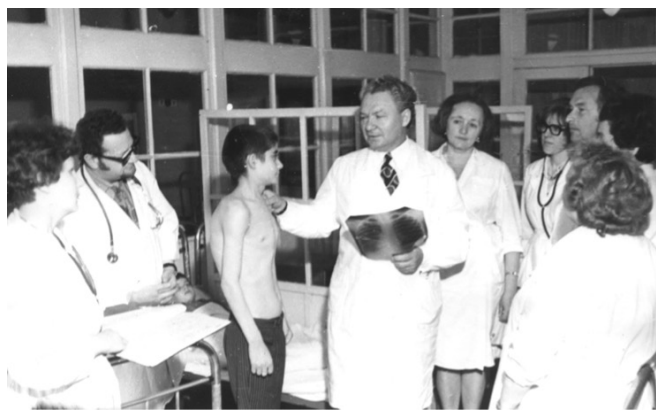
Обходы профессора С.Ю. Каганова в клинике (60-е и 80-е годы XX века)

С.Ю. Каганов — автор более 250 публикаций, в том числе 7 монографий и 4 изобретений. Труды С.Ю. Каганова отличаются широким охватом про-