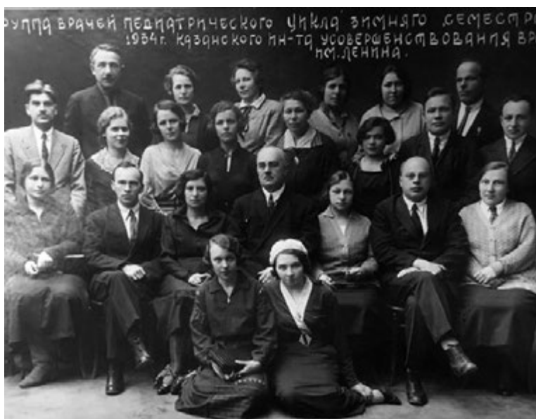
Рис. 3. Цикл повышения квалификации педиатров, ГИДУВ им. В.И. Ульянова-Ленина, март–июль 1934 г.

Fig. 3. The cycle of advanced training of pediatricians, State Institute for Additional Advanced Training of Physicians named after V.I. Lenin, Kazan, March–July 1934 (from the archive of the KSMA).