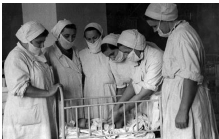
Рис. 4. Занятия в палате новорожденных детской клиники ГИДУВа им. В.И. Ульянова-Ленина, март–июль 1934 г. (из архива КГМА).

Fig. 3. The cycle of advanced training of pediatricians, State Institute for Additional Advanced Training of Physicians named after V.I. Lenin, Kazan, March–July 1934 (from the archive of the KSMA).