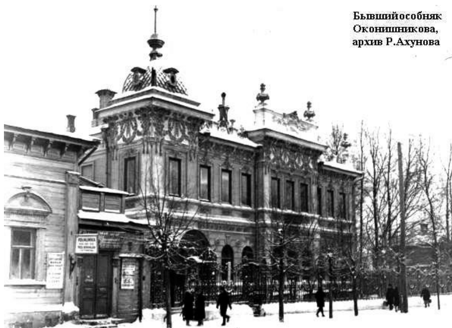
Бывший особняк Окопнишникова