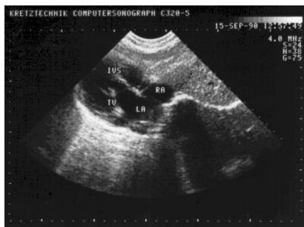
Рис. 2. Эхокардиограмма ребенка с транспозицией магистральных сосудов [Собственные данные].